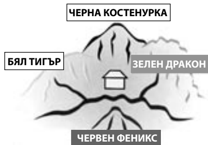
Фиг.1. Идеално разположение на дома според школата за земните форми

Вторият подход е основан на компаса – китайския луо пан. Компасът луо пан е различен от добре познатия ни компас, тъй като той не само сочи посоките, но включва и йероглифите на И Дзин, древната Книга на промените, която е и средство за допитване до съдбата в трудни моменти от живота. Съдържа в себе си и багуата, осмоъгълната форма, с която се определят посоките на света в китайския фън шуй.