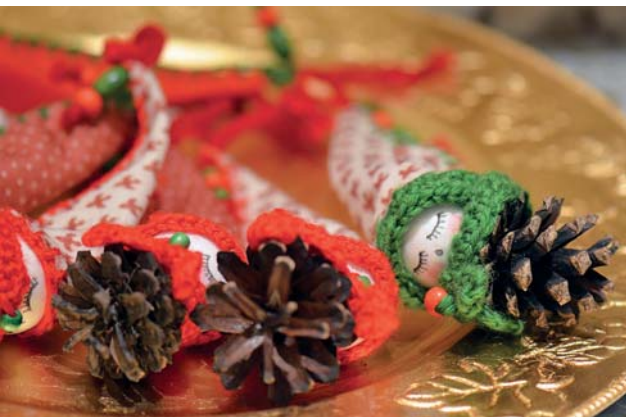
Коледни приказки разказваме на стр. 12, 14, 56, 67, 68, 72 и 80