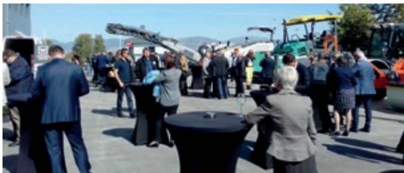
Официалното откриване на новия търговско-сервизен комплекс на Виртген България бе уважено от много гости