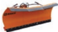
Гребло за сняг