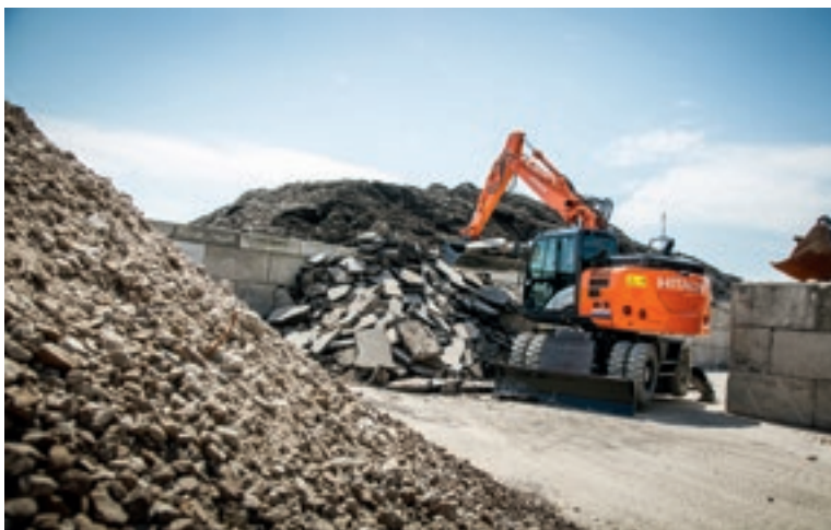
В най-новата гама колесни багери на Hitachi CM бе включен за първи път и 16-тонен модел ZX145W-6 с малък радиус на въртене на надстройката за оптимална работа в тесни пространства