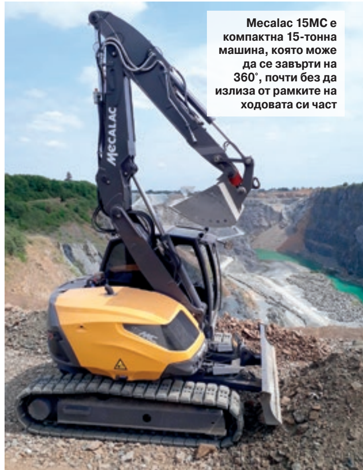
Mecalac 15MC е компактна 15-тонна машина, която може да се завърти на 360°, почти без да излиза от рамките на ходовата си част