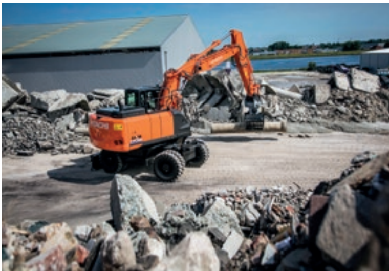
Освен със стрела моноблок Hitachi ZX170W-6 може да се достави и с хидравлично-съчленена стрела за постигане на още по-голяма функционалност