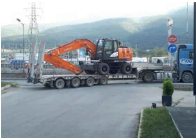
Hitachi ZX170W-6 тръгва към своя първи строителен обект