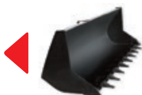
Строителна кофа със зъби