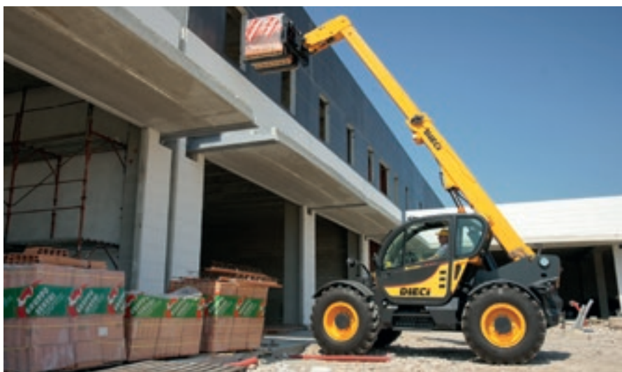
Строителните телескопични товарачи на Dieci могат да задоволят всички потребности на фирмите от работна височина и товароподемност