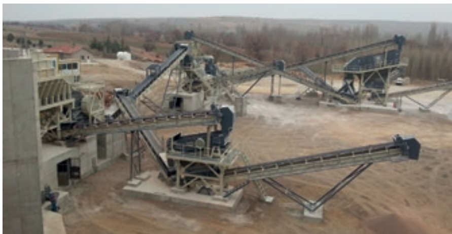
Гамата на Nace Makine включва богат асортимент от пресевни и трошачни инсталации, в т.ч. вертикален ротор