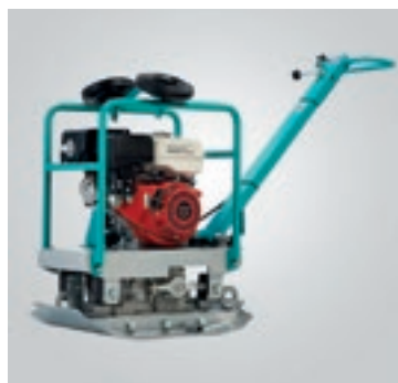
Леката строителна техника на Oscar се предлага с две години заводска гаранция