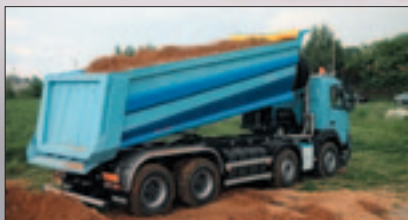
Самосвални надстройки конични с полукръгло сечение