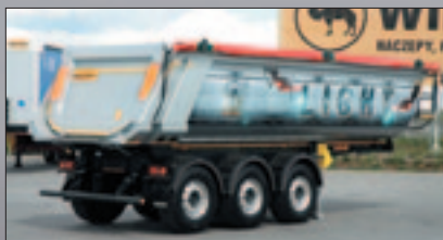
Самосвални полуремаркета алуминиев кош с полукръгло сечение