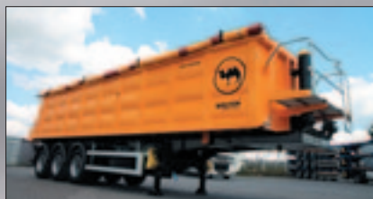
Самосвални полуремаркета стоманен кош с правоъгълно сечение