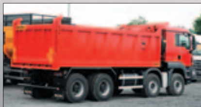
Самосвални надстройки с правоъгълно сечение