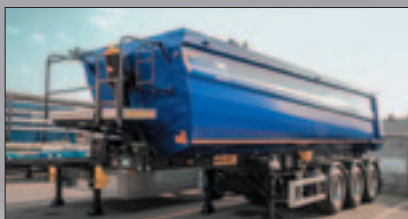
Самосвални полуремаркета стоманен кош, конични с полукръгло сечение