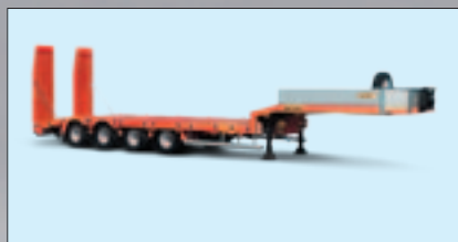
Полуремаркета за транспортиране на строителна техника с 3 и 4 оси, удължаване с 5 м