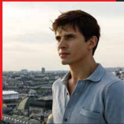
Рудолф Нуреев: Бялата врана