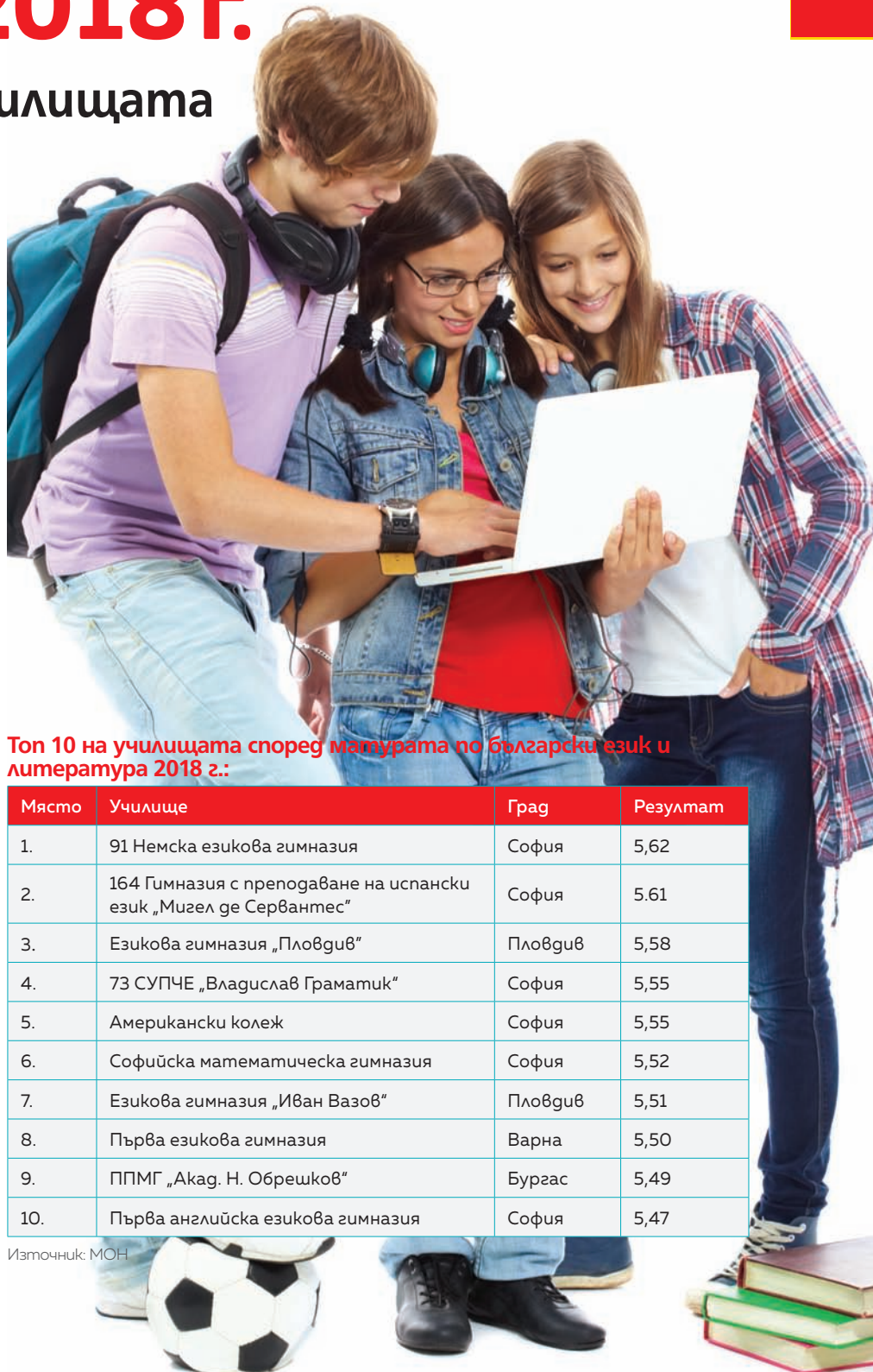
Топ 10 на училищата според матурата по български език и литература 2018 г.: