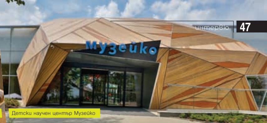
Детски научен център Музейко