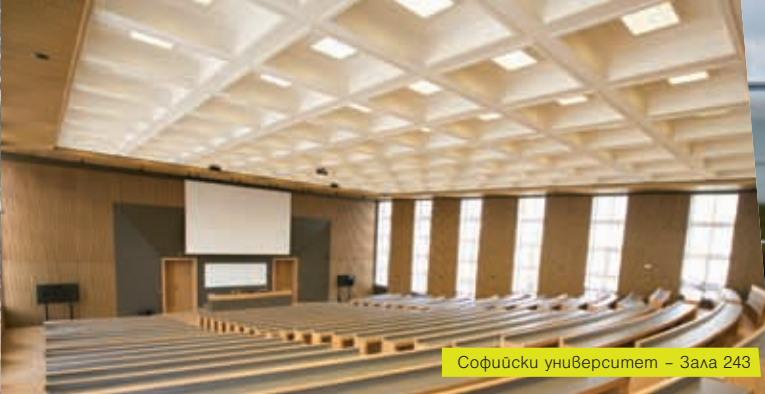
Софийски университет – Зала 243