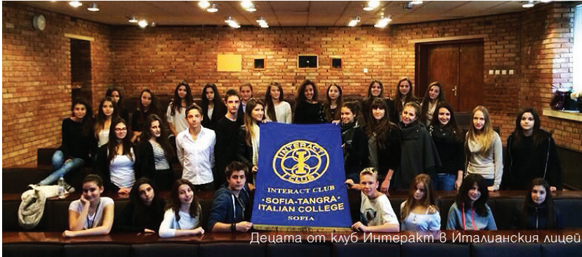
Децата от клуб Интеракт в Италианския лицей

На 28.02.2014 г. учениците от интеракт клуб София-Тангра към Италианския лицей организираха благотворително модно ревию в помощ на Мариян Георгиев от гр. Ловеч, който страда от хронична бъбречна недостатъчност. Събитието мина под знака на 10-годишнината на клуба и се състоя във Фабрика 126.