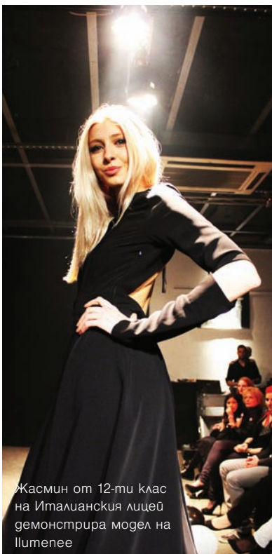
Жасмин от 12-ти клас на Италианския лицей демонстрира модел на Illuminee

Интеракт е инициатива на Ротари Интернешънъл за младежи на възраст между 12 и 18 години. Като една от най-важните и бързо развиващи се програми, Интеракт се е превърнал в световен феномен с почти 340 000 младежи в повече от 33 000 клуба в 200 страни. Интеракт дава възможност на младите хора от гимназиите да работят заедно в света на приятелството, на службата и международното разбирателство. Интеракторите развиват умения за ръководство и усвояват практически опит в провеждането на проекти за служба, а с това познават и удовлетворението, което идва от службата за другите. Основна цел на Интеракт е да дава възможности за младите хора да създават по-голямо разбирателство и добра воля с младежта по целия свят.