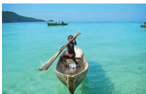
Екзотична дестинация - ХОНДУРАС