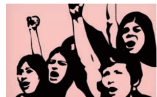
Нетрадиционна специалност ФЕМИНИЗЪМ