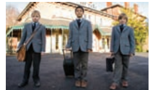
СРЕДНО ОБРАЗОВАНИЕ Как се избира бординг училище