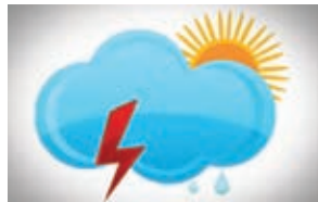
Нетрадиционна специалност: МЕТЕОРОЛОГИЯ