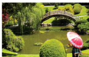
Нетрадиционна специалност ЛАНДШАФТНА АРХИТЕКТУРА