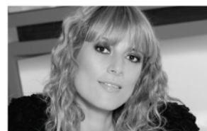
ЗВЕЗДЕН ЧАС Августина Маркова