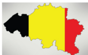
ПО ПРОГРАМА ЕРАЗЪМ в Белгия