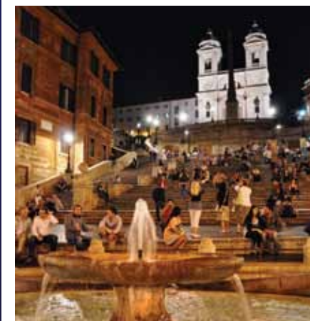
Снимка на корицата: Испанския площад, Рим (автор: Емил Данаилов)

Издател КЛАМЕР ООД e-mail: reklama@moetopatuvane.com