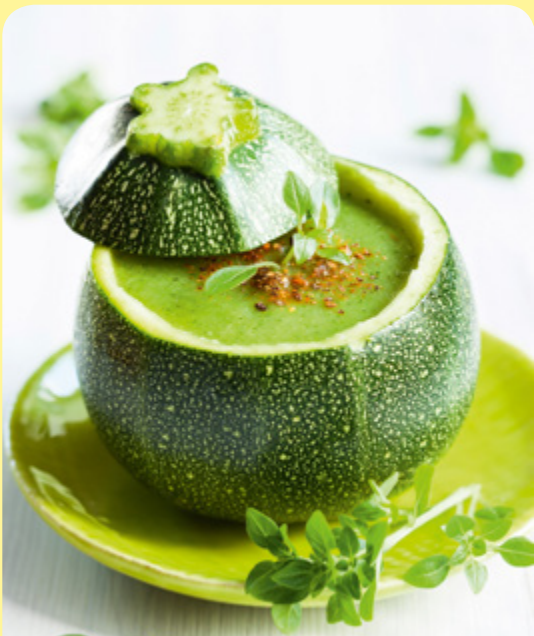
СТУДЕНА КРЕМ-СУПА ОТ ТИКВИЧКИ