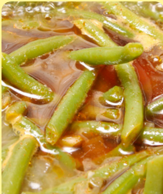
ЗЕЛЕН ФАСУЛ НА ФУРНА