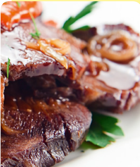
АГНЕШКО СЪС СОС ОТ СИНИ СЛИВИ