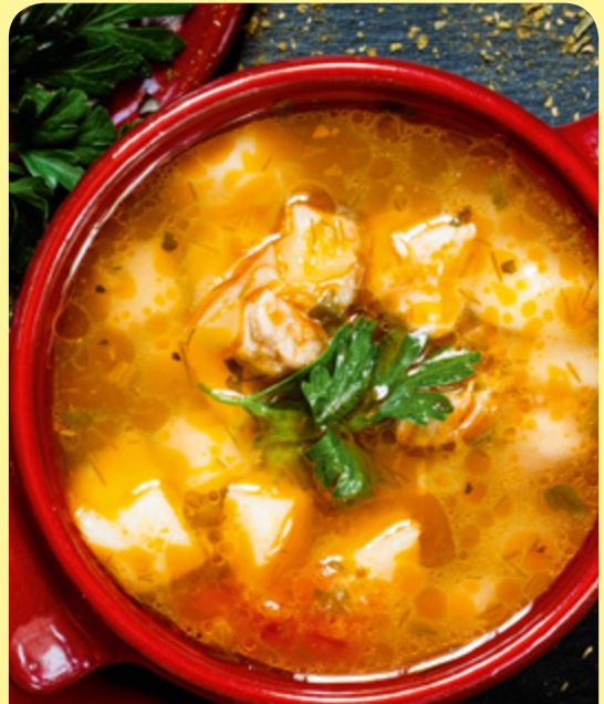
АГНЕШКА СУПА С МАГДАНОЗ