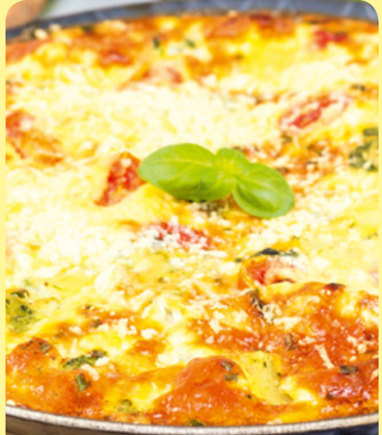
ЛАЗАНЯ ОТ КОПРИВА