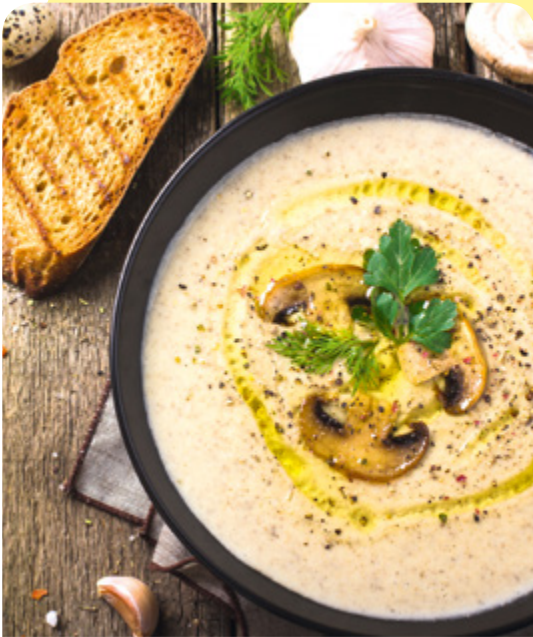
КРЕМ СУПА С ПРЕСЕН ЧЕСЪН