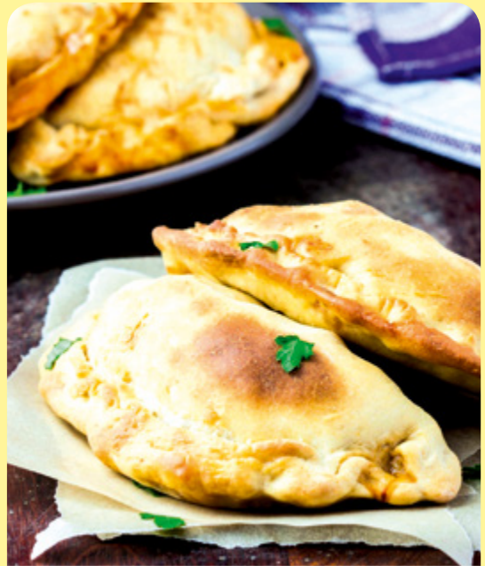
ЗАТВОРЕНА ПИЦА СЪС СПАНАК