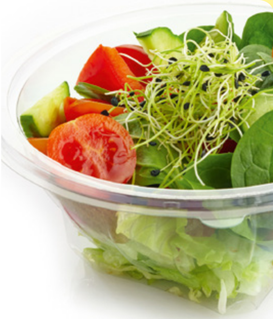
САЛАТА С КЪЛНОВЕ