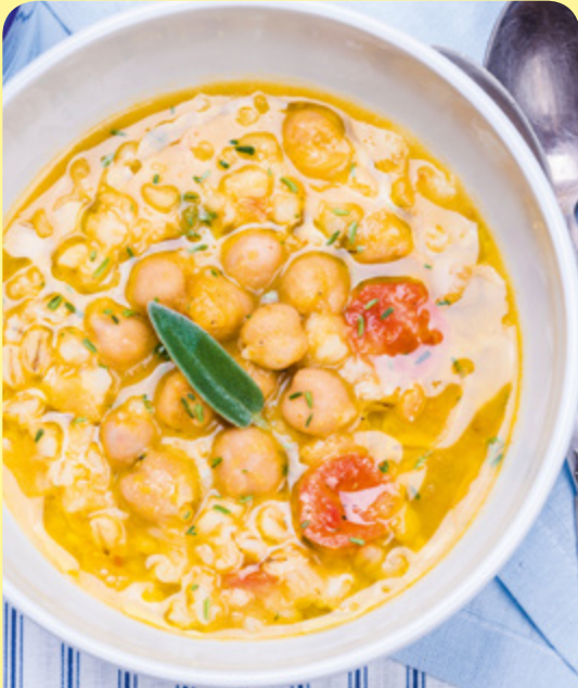
ЗЕЛЕНЧУКОВА СУПА С НАХУТ