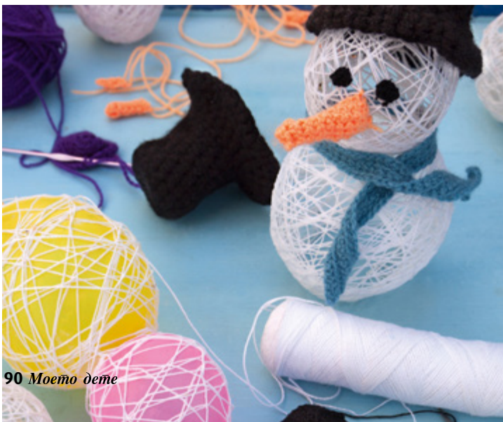
90 Моето дете

Материали: малки балони, лепило С 200, конци, дантели