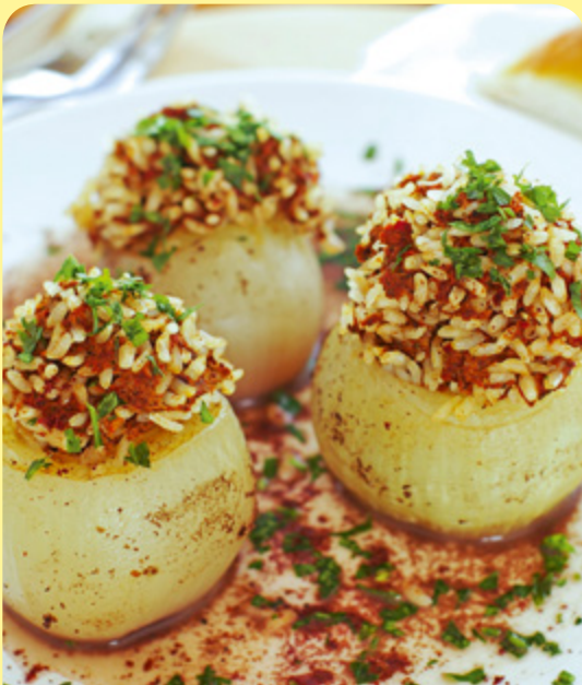
ЛУК С ОРИЗОВА ПЛЪНКА