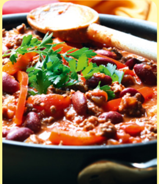
БОБ В ГЪРНЕ