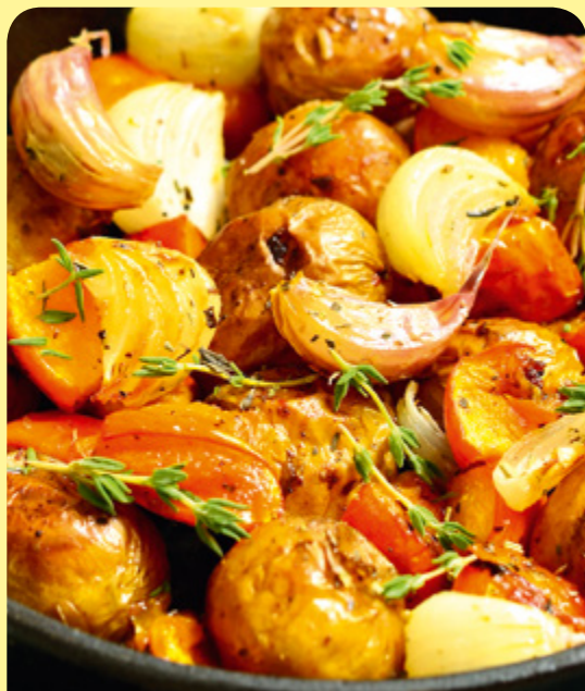
ЗЕЛЕНЧУЦИ С ЧЕСЪН И РОЗМАРИН