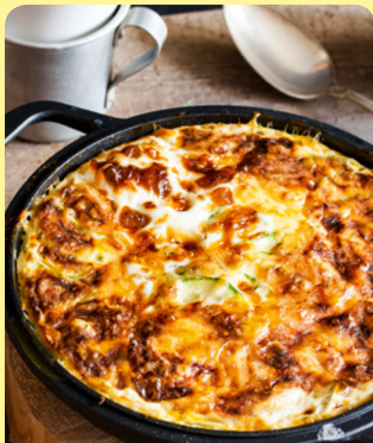
ЕСЕННА ЗЕЛЕНЧУКОВА ЗАПЕКАНКА