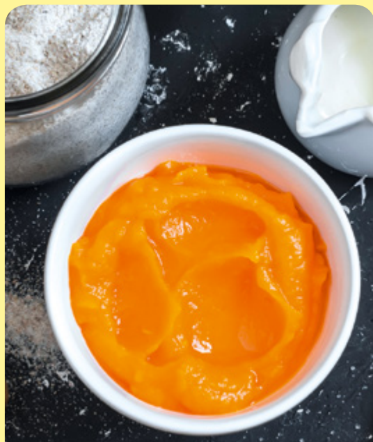
КРЕМ С МЛЯКО И ТИКВА