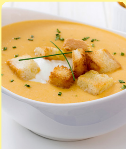
СМЕТАНОВА КРЕМ СУПА ОТ ТИКВА