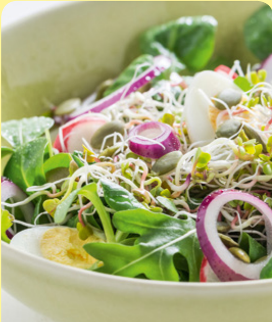
САЛАТА С КЪЛНОВЕ