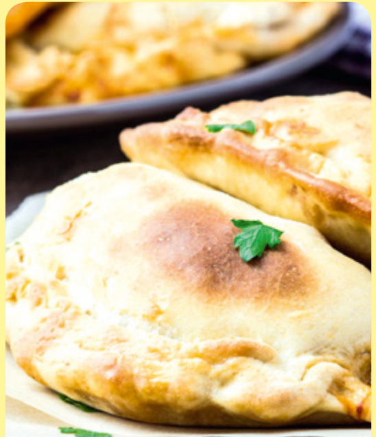
ЗАТВОРЕНА ПИЦА СЪС СПАНАК