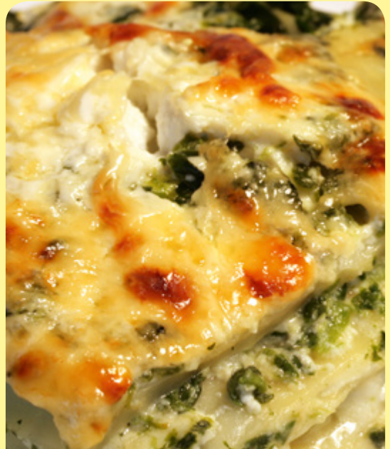
ЛАЗАНИЯ ОТ КОПРИВА