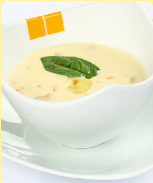
КРЕМ СУПА С ПРЕСЕН ЧЕСЪН