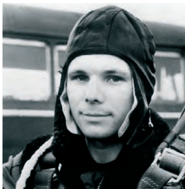
148 Легендата за изчезналите космонавти