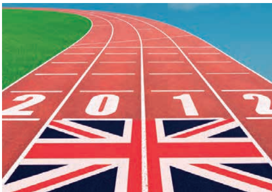
134 Alter ego: Българската слега на олимпиадата