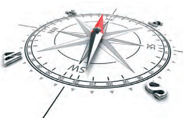
71 Bon voyage