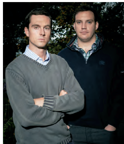
92 Какмо кажам местните