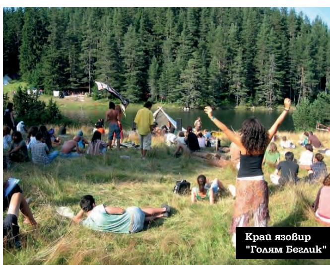
Край язовир "Голям Беглик"

Всеки април угва с любовния ми рефрен - "гай да мръднем някъде на юг". Чертая по картата нишка, с която придърпвам лятото по-близо, заживявам го, преди още да е дошло. Привиждам ми се циганските колела по плажа. Средиземноморските медузи, които рано сутрин приближават брега като плаващи цветни букети - все едно ти се погаряват. Погупите глезени по паветата в Рим. Отърсването от жегите на севера с летните нощи на ферибот пог сияйното шведско небе. Връщането обратно през нереалните каньони на Черна гора. Дигжейският пулт, кацнал на гърво край язовир "Голям Беглик", и пощурелите детски крака във водата. Нюансите на индийската кухня, на аржентинския футбол, на точките по роклите на момичетата, танцу-