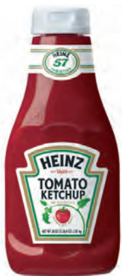
52 Тереза Хайнци, или птиче на рамото