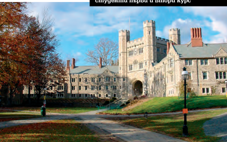
Това е Blair Hall - общежитие за студенти първи и втори курс