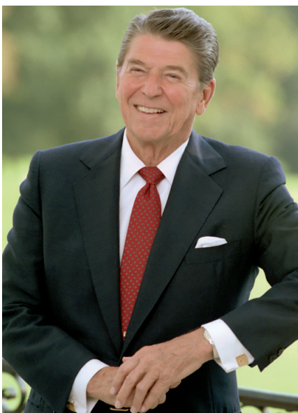
Актьорът Роналд Рейгън успя да измами руснаците с междузвездни войни

Другият елемент на явлението е забавното шоу. Впрочем актьора често го сравняват с политика, доколкото и двете професии се изиявяват на сцена. И понеже погудимите, пълнитрите и президиумите днес навяват неударима скука, двата персонажа почват да се сливат върху екрана: кино-, телевизионен, а вече и компютърен. Прочум е случаят с Роналд Рейгън, който изигра убедително най-големия блъф в историята на международните отношения, като излъга руснаците, че готви система за междузвездни войни, за да ги принуди да се разоръжат. Знаем и за злополучния терминатор на Калифорния Шварценегер, за многото губернатори на индийски провинции, та дори за гецата актьори Качински, станали политици пак заедно, както често се случва с близнаците. Малко по-друг тип са персонажи като очарователната актриса и певица Ева Перон, наследила мъжа си в президентството на Аржентина и разбира се(!), шеметната Чичолина, която стана депутат в италианския парламент от Рагу-