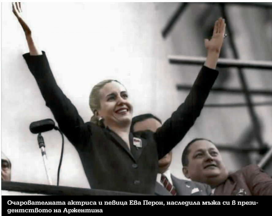
Очарователната актриса и певица Ева Перон, наследила мъжа си в президентството на Аржентина