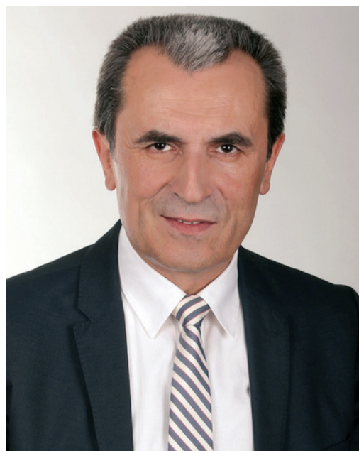
ПЛАМЕН ОРЕШАРСКИ , министър-председател на Република България

Пожелавам на целия екип здраве, нестихваща енергия и силна мотивация, за да посрещате успешно бъдещите предизвикателства. Честит празник и на добър час!