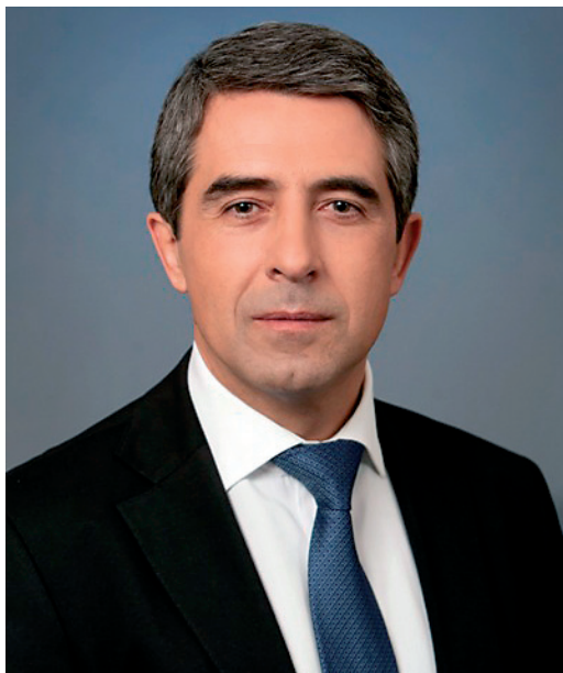
РОСЕН ПЛЕВНЕЛИЕВ президент на Република България