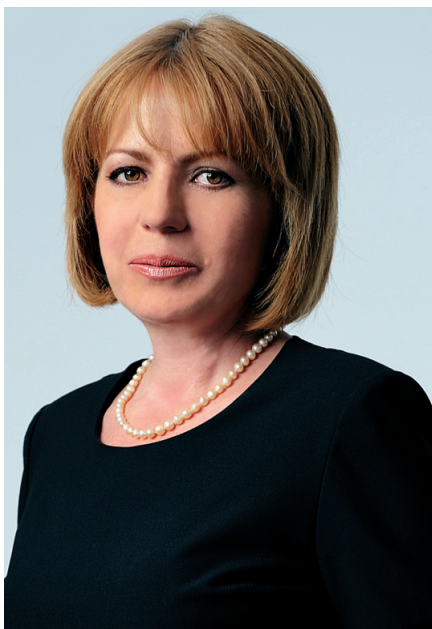
ЙОРДАНКА ФАНДЪКОВА кмет на София