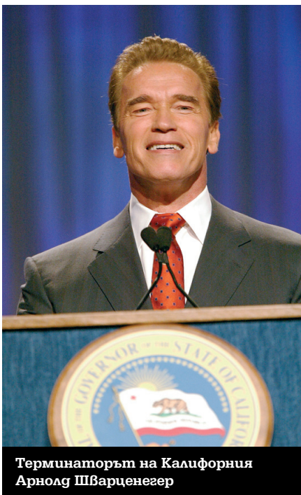
Терминаторът на Калифорния Арнолд Шварценегер