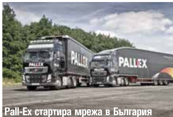
Pall-Ex стартира мрежа в България

Компаниите Kawasaki Kisen Kaisha, Mitsui O.S.K. Lines и Nippon Yusen Kabushiki Kaisha обявиха, че съвместното им дружество за линейни контейнерни превози ще носи името Ocean Network Express. Трите дружества обявиха създаването на джойнтвенчъра помежду си на 31 октомври 2016 г. Съвместното им сдружение ще интегрира контейнерния бизнес на трите линейни оператори по света, заедно с терминалите им (с изключение на тези в Япония). Регионалните цабове на новото дружество ще бъдат установени в Сингапур, Хонконг, Лондон, Ричмонд (САЩ) и Сао Пауло (Бразилия). Обявената дата за стартиране на Ocean Network Express е 1 април 2018 г., като това ще стане, след като бъдат издадени всички разрешения от компетентните органи в страните, където ще оперира новата компания.