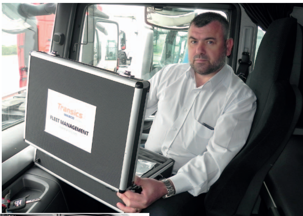
Бордовият компютър TX-SKY

MVB Truck and Bus Bulgaria е официален представител на Transics International BVBA. Така официалният вносител на MAN Truck and Bus вече предлага на българския пазар и продуктите и услугите на белгийската компания