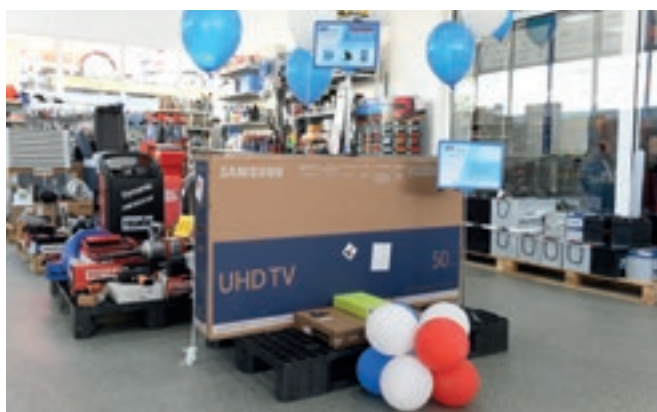
Наградите за играта за клиентите на фирмата