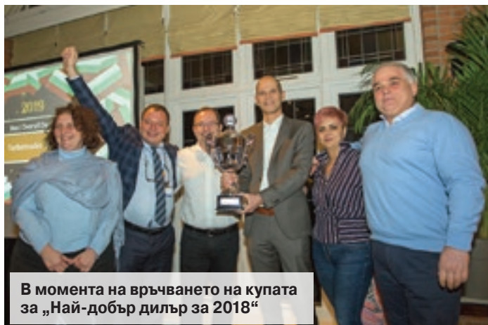
В момента на връчването на купата за „Най-добър дилър за 2018“