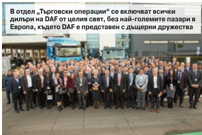
В отдел „Търговски операции“ се включват всички дилъри на DAF от целия свят, без най-големите пазари в Европа, където DAF е представен с дъщерни дружества

рия за 2018 г. с 20% пазарен дял, и то на пазар, който порасна с над 35%. С 25% увеличихме продажбите на резервни части. Имаме едно от най-високите нива на обслужване – 95%. Отзивите на българските и чуждестранните ни клиенти за следпродажбеното обслужване са отлични.