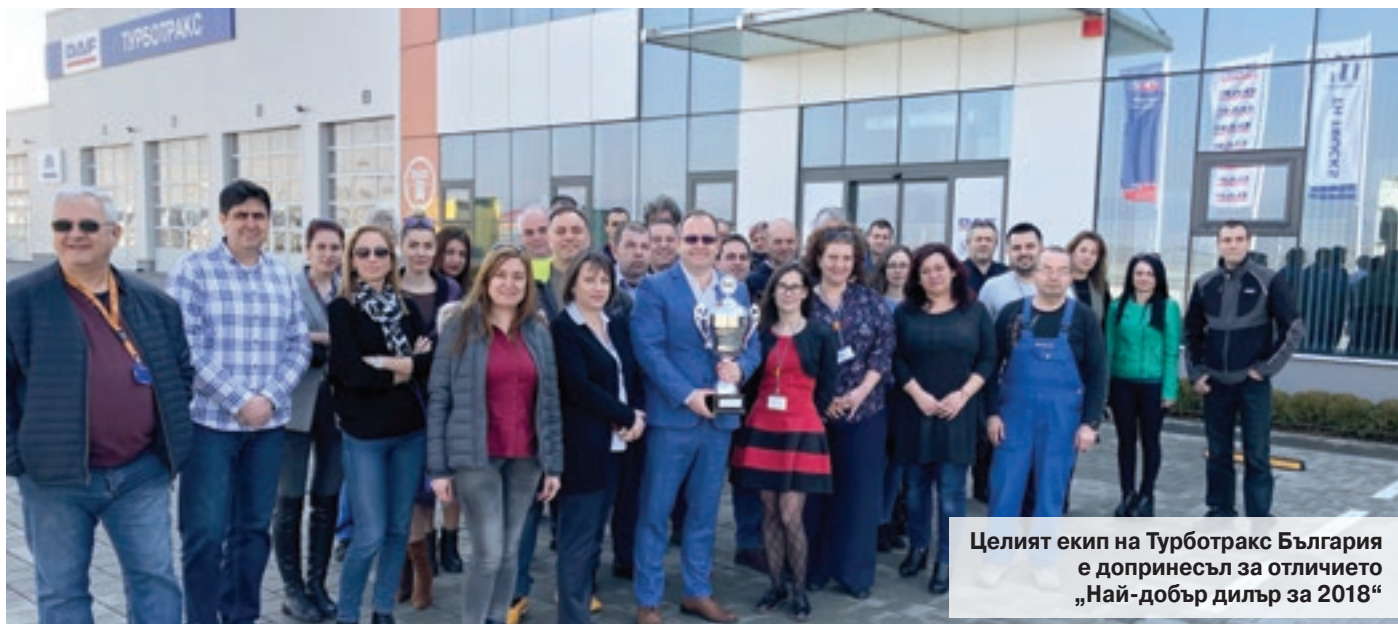
Целият екип на Турботракс България е допринесъл за отличieto „Най-добър дилър за 2018“