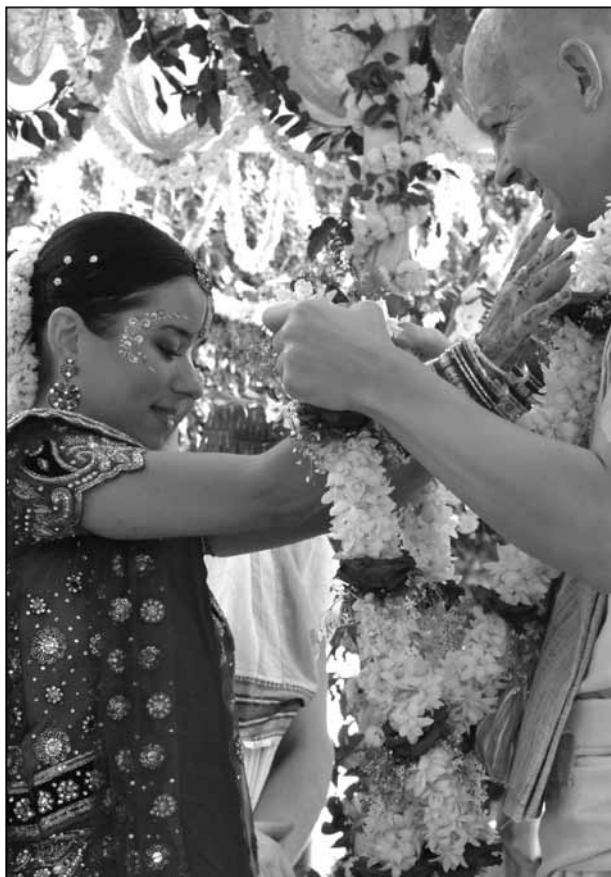
По време на вивака-самскара младоженците си разменят пъстри гирлянди от благоуханни цветя.

В наши дни, в различни общества съществуват множество церемонии, които хората приемат като светски сбирки за общуване с роднини и познати и ги изпълняват по инерция – без да вникват в техния по-дълбок и сакрален смисъл. Ведическите ритуали за благочестив живот, известни като самскари (от санскрит сам-с-кара – свършено действие ) са предназначени да допринасят за материалното и духовно благоденствие на човечеството. Ведическите писания посочват, че самскарите имат благотворен, пречистващ и освещаващ ефект за преките участници в тях, за всички присъстващи и