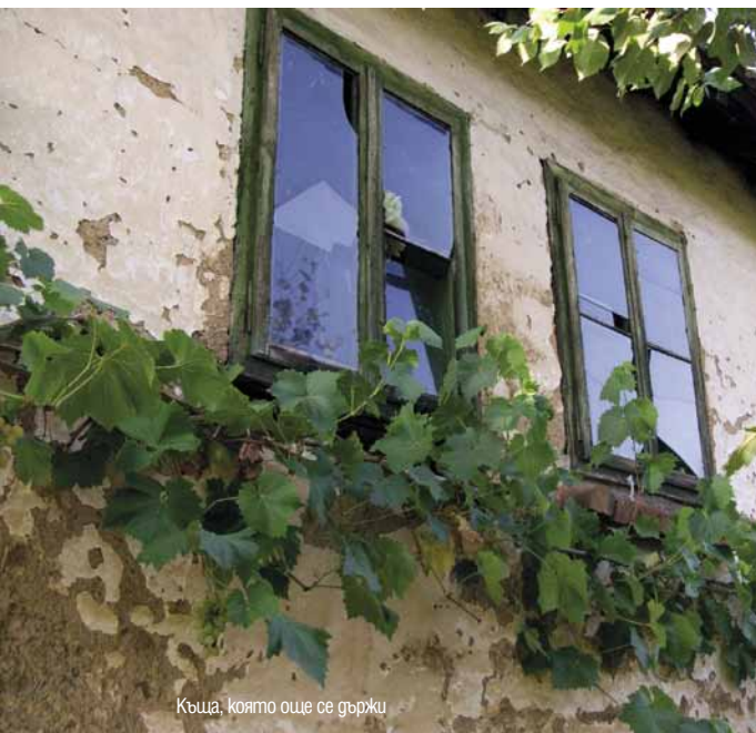
Къща, която още се гържи