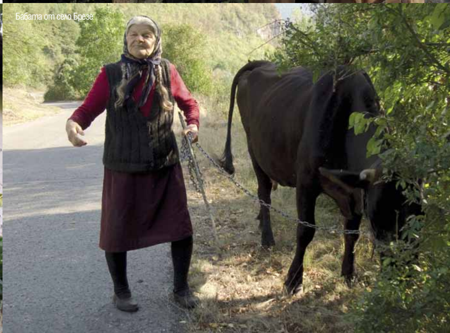
Баба от село Брезе

Крежка дървена порта, която прегражда пътя. Това не е знак за частен имот, а опит да се спрат дивите животни.