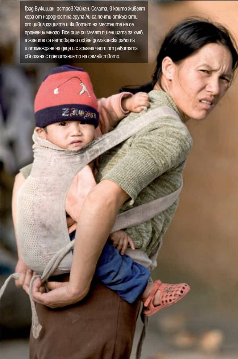
Град Вужижан, остров Хайнан. Селата, в които живеят хора от народностна група Ли са почти откъснати от цивилизацията и животът на местните не се променил много. Все още си мелят пшеницата за хляб, а жените са натоварени освен домакинска работа и отглеждане на деца и с голяма част от работата свързана с препитанието на семейството.