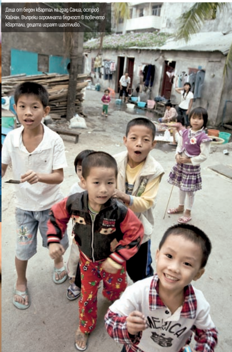
Деца от беден квартал на град Саниа, остров Хайнан. Въпреки огромната бедност в повечето квартали, децата играят щастливо.