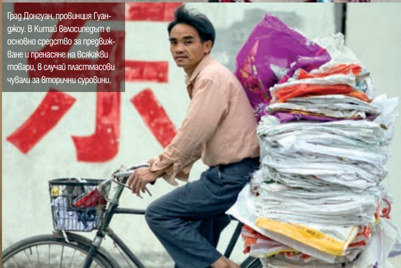
Град Донсуан, провинция Гуанджоу. В Китай велосипедът е основно средство за предвижване и пренасяне на всякакви товари, в случай пластмасови чували за вторични суровини.