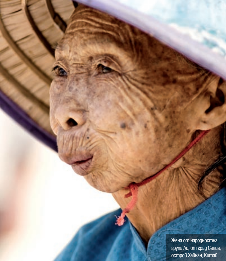
Жена от народностна група Ли, от град Саниа, остров Хайнан, Китай