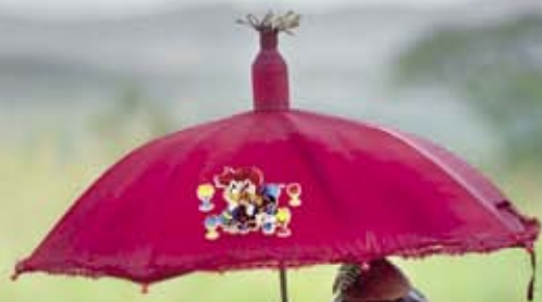
Момичето с чадър