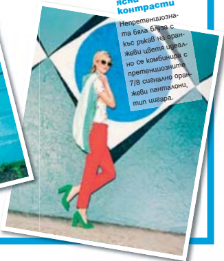
Силни цветове, ясни контрасти

Бледокафява рокля на бял хоризонтален райе с характерно корсажно декоративно обемна пола „фуния“.