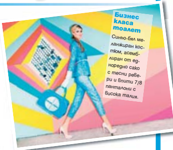
Бизнес класа тоалет

Американската авиокомпания „Пан Ам“ е основана през 60-те години на миналия век, за да обслужва джет сет начина на живот на група космополити от богатите слоеве на обществото, които обичали да прекарват времето си в пътешествия на авиолайнери. Точно тази аеросуинг мода от 60-те отново се завръща това лято – с женствени линии, къси поли и бухнали рокли.