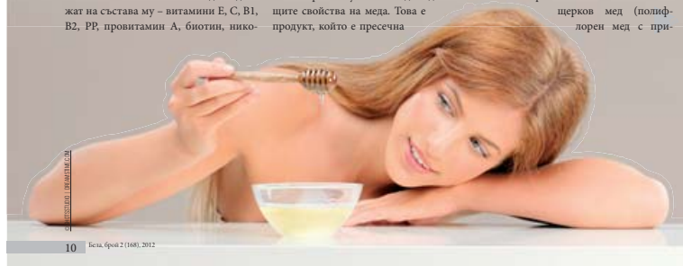
10 Бела, брой 2 (168), 2012