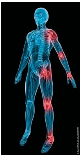
от колянната става (артроза на колянената става).

Интересни проучвания сочат, че ако човек не стъпва на краката си в продължение на шест месеца, може да развие по-ранна артроза, отколкото никога, който се занимава активно със спорт. Така че и липсата на движение също не е гаранция, че ще се спасим от артроза. Освен това продължителното бездействие става причина за понижен метаболизъм, както и за развитие на остеопороза. Докладно е, че жените по-често боледуват от артроза. Особено