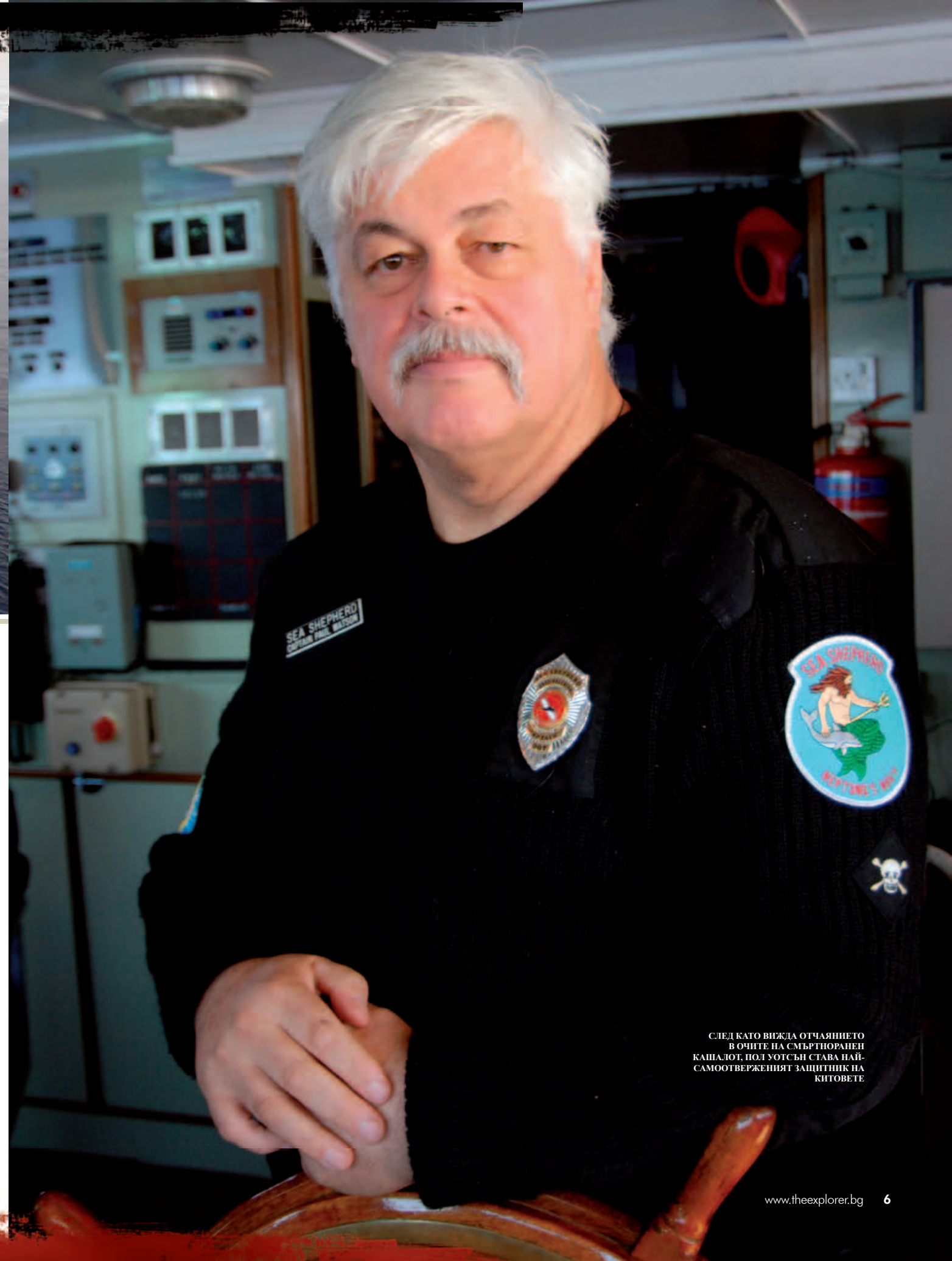
СЛЕД КАТО ВИЖДА ОТЧАЯНИЕТО В ОЧИТЕ НА СМЪРТНОРАЩЕН КАШАЛОТ, ПОЛ УОТСЪН СТАВА НАЙ- САМООТВЕРЖЕНИЯТ ЗАЩИТНИК НА КИТОВЕТЕ

около о. Амчитка. Акцията е спонсорирана от противоядрената организация Don't Make a Wave. Като член на екипажа на „Грийнпийс II“ (бивш противоминен кораб на канадската военна флота) Уотсън системно патрулира около острова. Оказаният натиск принуждава Американската агенция по атомна енергия окончателно да прекрати експерименталните взривове. През 1972 г. Уотсън поема командването на друг кораб на Грийнпийс – „Астрал“. С кораба си той възпрепятства отплуването на френския самолетносач „Жана д'Арк“ от пристанището на Ванкувър, като по този начин протестира срещу ядрените опити, които Франция извършва на атола Мурoa. През 1974 г. Пол Уотсън, Робърт Хънтър и д-р Пол Спонг заедно с други природозащитници организират първата международна протестна акция срещу лова на китове. По-нататъшната кариера на Уотсън е силно повлияна от едно драматично събитие през юни 1975 г.