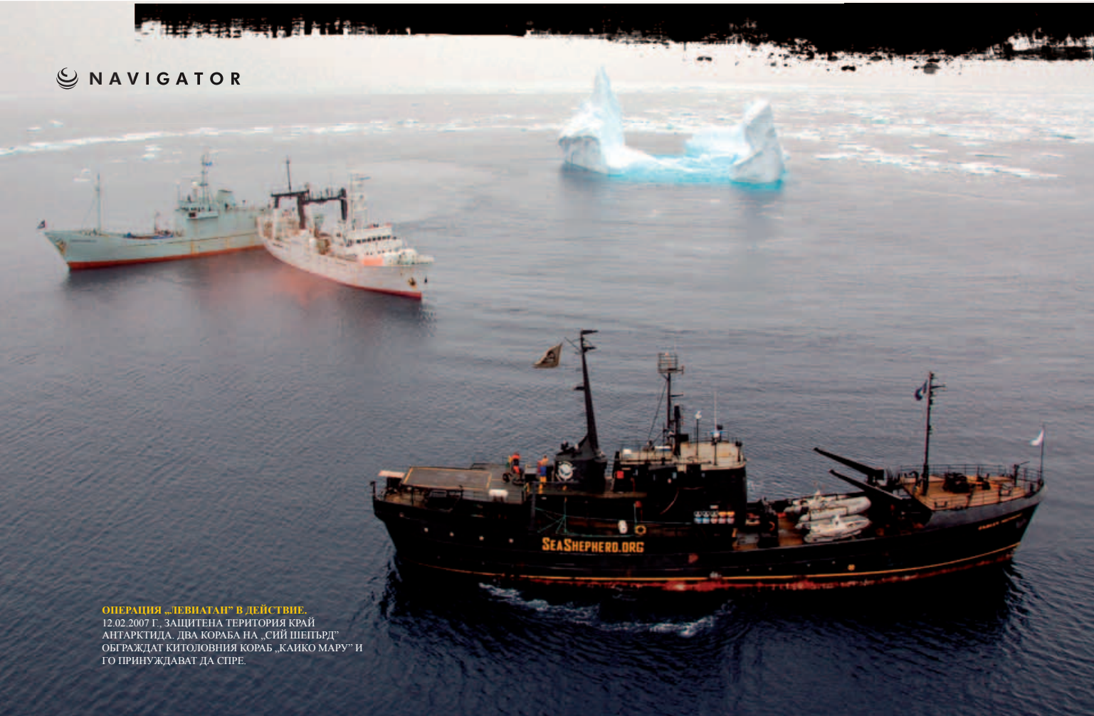
ОПЕРАЦИЯ „ЛЕВИТАН“ В ДЕЙСТВИЕ. 12.02.2007 Г., ЗАЩИТЕНА ТЕРИТОРИЯ КРАЙ АНТАРКТИДА. ДВА КОРАБА НА „СИЙ ШЕПЪРД“ ОБГРАЖДАТ КИТОЛОВНИЯ КОРАБ „КАЙКО МАРУ“ И ГО ПРИНУЖДАВАТ ДА СПРЕ.