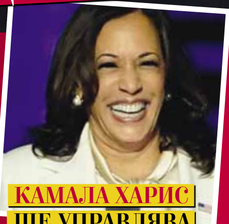
КАМАЛА ХАРИС ЩЕ УПРАВЛЯВА АМЕРИКА