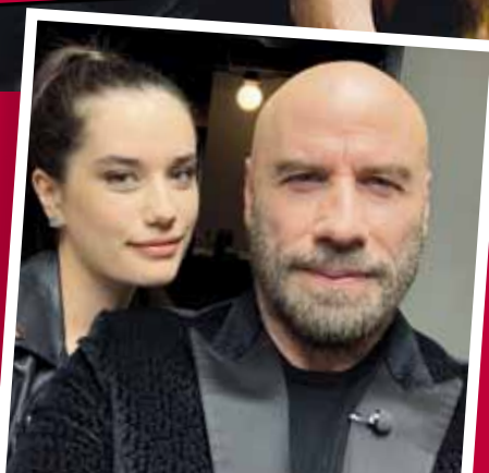
ДЕЦАТА НА ЗВЕЗДИТЕ КАТО ДВЕ КАПКИ ВОДА