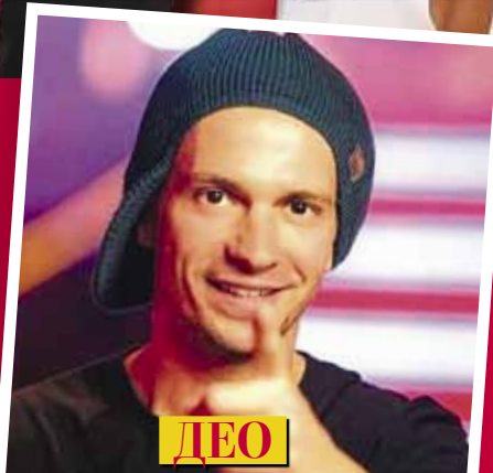
ДЕО ПЪРВАТА ЗАЛОВЕНА С НАРКОТИЦИ ЗВЕЗДА