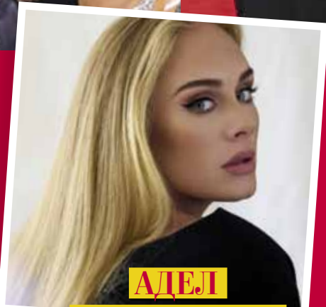
АДЕЛ СЕ ЗАВРЪЩА ПРЕРОДЕНА