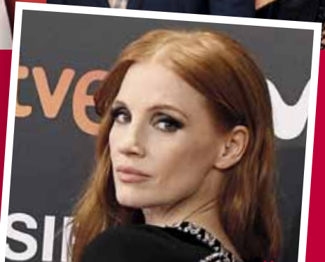
ДЖЕСИКА ЧАСТЕЙН НЕ ИСКА ДА ПРИЛИЧА НА ДЖОЛИ