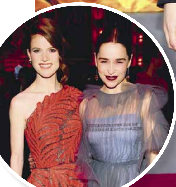
Роуз Лесли и Емилия Кларк