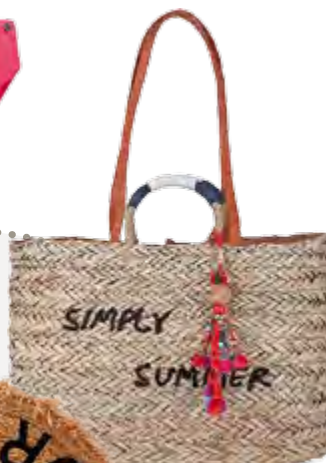
Чанма ACHILLEAS Accessories*