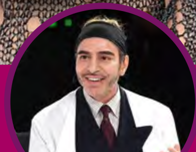
ДИЗАЙНЕРЪТ ДЖОН ГАЛИАНО