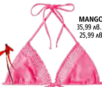
MANGO, 35,99 лв. и 25,99 лв.