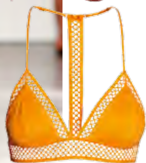
H&M, 24,99 лв. и 17,99 лв.