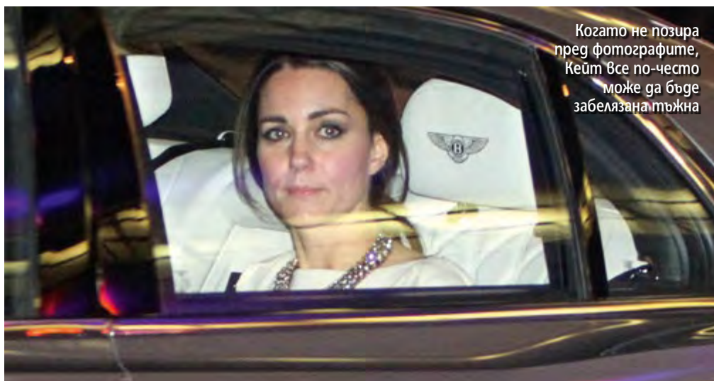
Когато не позира пред фотографите, Кейт все по-често може да бъде забелязана тъжна

Още през 2015 г. се заговори, че бракът на кралската двойка е на път да се срине, а причината била новата сътрудничка на принца, с която той прекарвал много време. Това пък предизвиквало невиджана ревност в съпругата му и тя от своя страна не спирала да му натяква този факт.