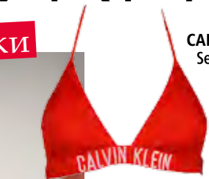
CALVIN KLEIN om Seven Seconds, 160,90 лв.