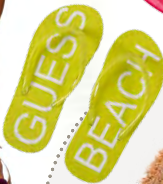
Джананки GUESS om Seven Seconds, 63,90 лв.