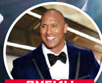
ДУЕИН ДЖОНСЪН СКАЛАТА

Как да се справим с най-коварния си враг