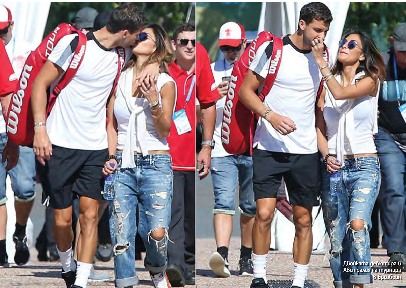
Двойката дебютира в Австралия на турнира в Бризбейн

танското издание на X Factor ще бъде подновен и тя отново ще се изявява като ментор в музикалното предаване. „Вече обсъждаме този въпрос. Толкова много се забавлявах по време на шоуто, че изобщо не го чувствах като работа. Беше много весело. С останалите ментори имахме невероятна химия помежду си, енергията беше страхотна ▶