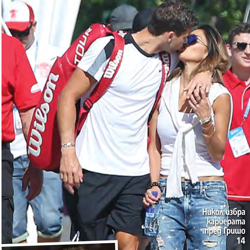
Никол избира кариерата преди Гришо 14