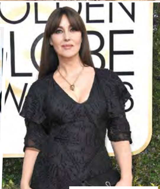
МОНИКА БЕЛУЧИ отново пленяваше с фаталния си чар