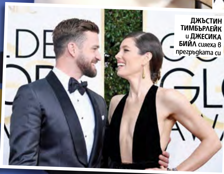
ДЖЪСТИН ТИМБЪРЛЕЙК и ДЖЕСИКА БИЙЛ сияеха в прегръдката си