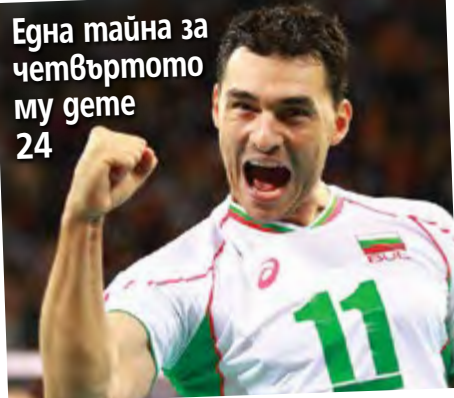
Една тайна за четвъртото му дете 24