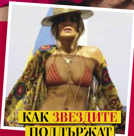
КАК ЗВЕЗДИТЕ ПОДДЪРЖАТ ТЕЛАТА СИ