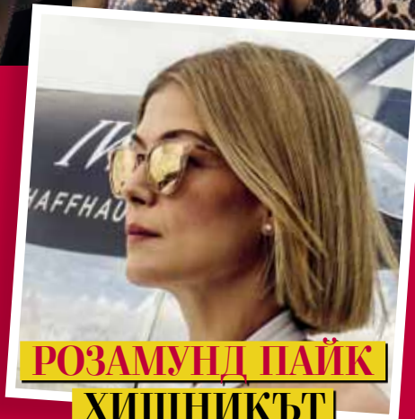
РОЗАМУНД ПАЙК ХИЩНИКЪТ НА ХОЛИВУД