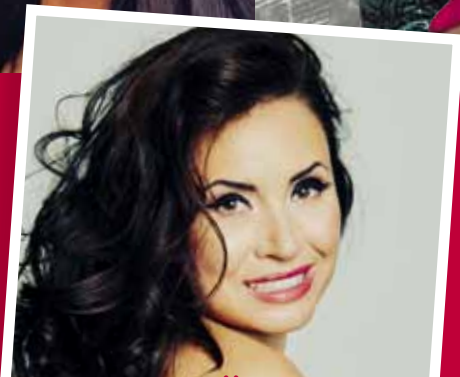
СОНИЯ ЙОНЧЕВА ДИВАТА, КОЯТО СЪЗДАДЕ ИМПЕРИЯ