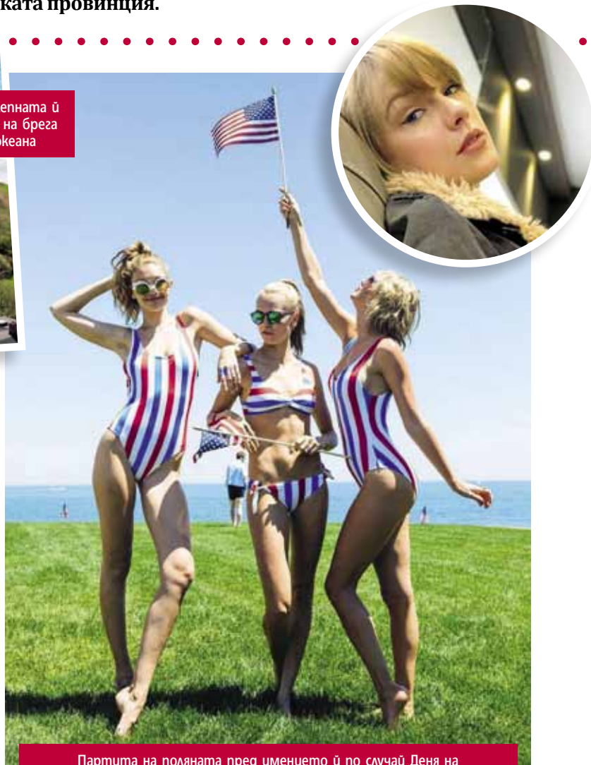
Партита на поляната пред имението ѝ по случай Деня на независимостта са запомнящи се

П реди тя живееше в Лос Анджелис, Ню Йорк и Нешвил. Сега е избрала за себе си по-тих пристан – Уестърли, щата Роуд Айлънд. Макар да е млада, на Тейлър явно все повече ѝ писва от купони и предпочита, когато почива, да се затваря в имението си за 17 млн. долара на брега на океана. Да, ако на 4 юли, Деня на независимостта, сте в градчето с около 23 000 жители, ще разберете веднага къде е къщата на певицата, защото по традиция всяка година на този ден тя прави там големи партита, музиката от които се чува надалеч. Между впрочем, откакто се премести в Уестърли, малкото населено място неочаквано се превърна в топ дестинация за младите. Много от тях, разбира се, се надяват докато се разхождат, да зърнат любимката си. Примерно в някое от местните заведения, като Olympia Tea Room и The Cooked Goose, за които е известно, че певицата понякога посещава.