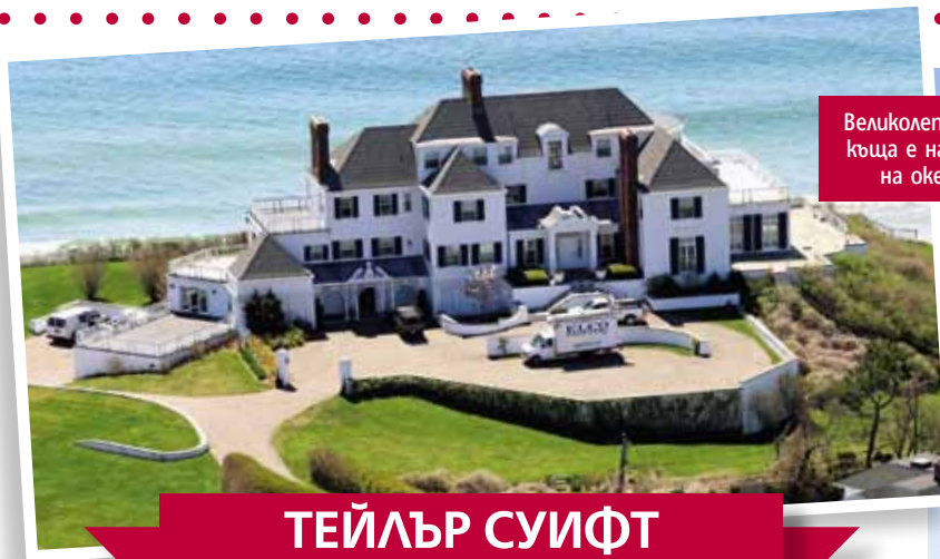
Великолепната ѝ къща е на брега на океана

З а много холивудски звезди Лос Анджелис продължава да бъде най-вдъхновяващото място, където блясъкът на славата им ги опиянява на всяка крачка. Но някои от тях постепенно са осъзнали колко ценни са тишината и уединението. Те работят на бързи обороти и печелят милиони, но когато почиват и искат да са със семействата си, предпочитат поне за малко да бъдат като обикновените хора. Затова избират за свой дом някое тихо, малко градче, където да направят своя оазис на спокойствието. Ето някои от известните личности, които избраха да живеят в дълбоката провинция.