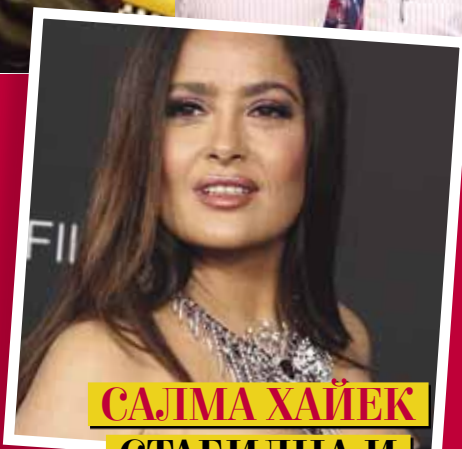
САЛМА ХАЙЕК СТАБИЛНА И НЕУМОРНА