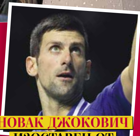
НОВАК ДЖОКОВИЧ ИЗОСТАВЕН ОТ СИЛАТА