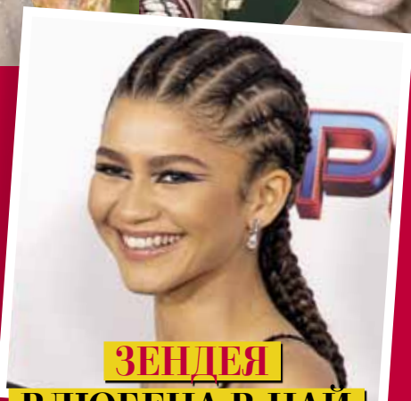
ЗЕНДЕЯ ВЛЮБЕНА В НАЙ- ДОБРИЯ СИ ПРИЯТЕЛ