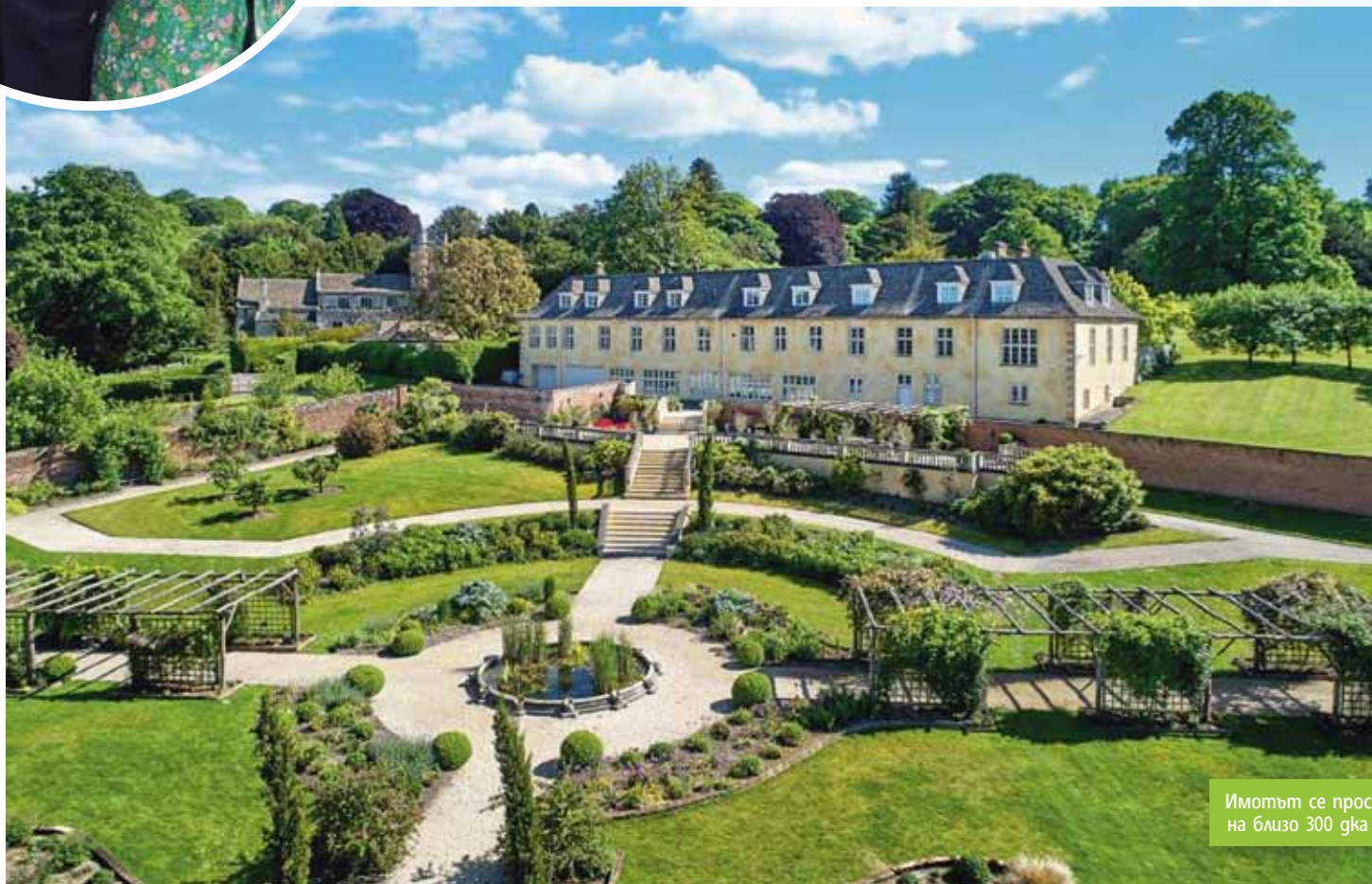
Имотът се простира на близо 300 дка земя

П оп идолът продава прочутото си имение в селцето Комптън Басет в графство Уилтшър. Семейната къща на Роби Уилямс в красивата провинция на Югозападна Англия (на 85 мили от Лондон) е добре известна на феновете му още преди години - когато той веднъж сподели, че според него е обитавана от духове. Днес Роби и съпругата му Айда Фийлд са решили да се разделят с мястото, което притежават от 2008 г.