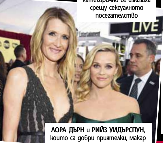
ЛОРА ДЪРН и РИЙЗ УИДЪРСПУН , които са добри приятелки, макар и да подкрепиха каузата на колежките си, си спестиха речите

ПАРТИ Шум Как и с кого се забавляват известните Лос Анджелис НАГРАДИ Гилдията срещу холивудския фалш Н аградите на Гилдията на актьорите се превърнаха в конференция за защита на жените и така продължиха темата от „Златен глобус“. И тя май няма да приключи поне до връчването на най-престижните статуетки „Оскар“. Този път обаче актрисите не бяха в черни рокли в знак на протест, а предпочетоха да „дадат цвят“ на шоуто.