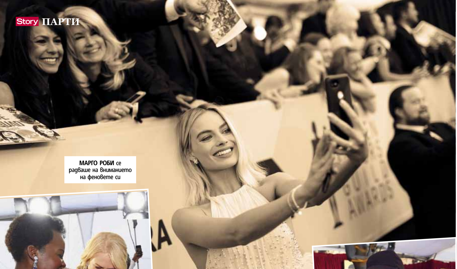
МАРГО РОБИ се радваше на вниманието на феновете си