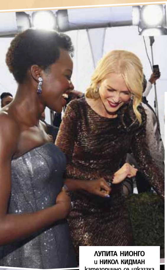
ЛУПИТА НИОНГО и НИКОЛ КИДМАН категорично се изказаха срещу сексуалното посегателство