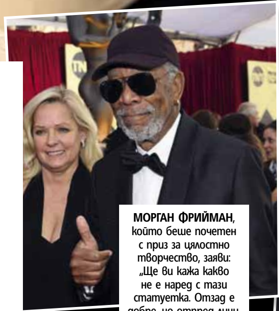
МОРГАН ФРИЙМАН , който беше почетен с приз за цялостно творчество, заяви: „Ще ви кажа какво не е наред с тази статуетка. Отзад е по-добре, но отпред личи, че е от определен пол“

ПАРТИ Шум Как и с кого се забавляват известните Лос Анджелис НАГРАДИ Гилдията срещу холивудския фалш Н аградите на Гилдията на актьорите се превърнаха в конференция за защита на жените и така продължиха темата от „Златен глобус“. И тя май няма да приключи поне до връчването на най-престижните статуетки „Оскар“. Този път обаче актрисите не бяха в черни рокли в знак на протест, а предпочетоха да „дадат цвят“ на шоуто.