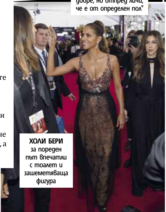
ХОЛИ БЕРИ за пореден път впечатли с тоалет и зашеметяваща фигура