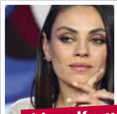
Мила Кунис и още...