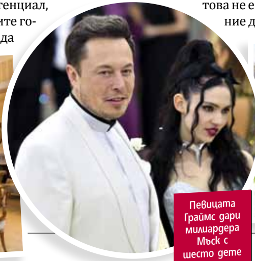
Певицата Граймс дари милиардера Мъск с шесто дете