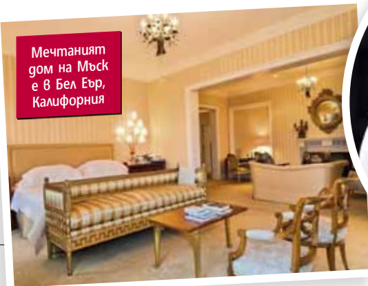
Мечтаният дом на Мъск е в Бел Еър, Калифорния

че чувства по друг начин бащинството, когато се е сдобил с дете на по-зряла възраст и че е в компанията на Екс много повече време, отколкото е бил с предишните си деца. Половинката му Граймс пък сама разкри, че е била изненадана колко много се е привързала към момченцето си, след като никога преди това не е мислила за майчинството и не е имала желание да има деца.