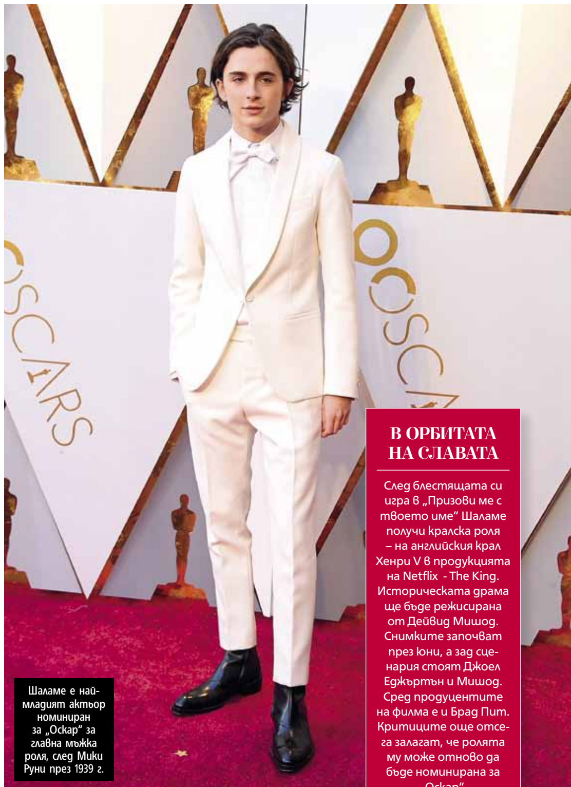
Шаламе е най-младият актьор номиниран за „Оскар“ за главна мъжка роля, след Мики Руни през 1939 г.

Тимъти е сред звездите на продукцията на 82-годишния Алън, обвинен преди време от осиновената си дъщеря Дилън