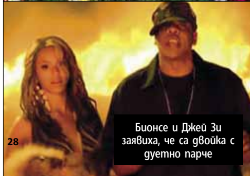
Бионсе и Джей Зи заявиха, че са двойка с гуетно парче