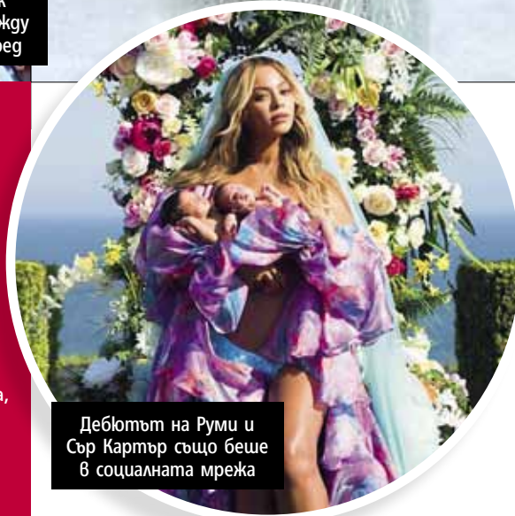
Дебютът на Руми и Сър Картър също беше в социалната мрежа

Разбира се, не всичко в живота на Бионсе може да минава по план. Доказателство за това беше скандалът през 2014 г. след грандиозното фешън събитие MET Gala. Тогава видео от камерите в хотела, в който се провеждаше партито, записаха скандал в асансьора между Джей Зи и сестрата на Бионсе – Соланж. Въпреки че и до днес никой от тях не даде публичен коментар защо тя му крещи и го бута, слуховете носеха, че Соланж е бясна заради изневерите на рапъра. Кое то впоследствие се потвърди и от албума на Бионсе Lemonade.