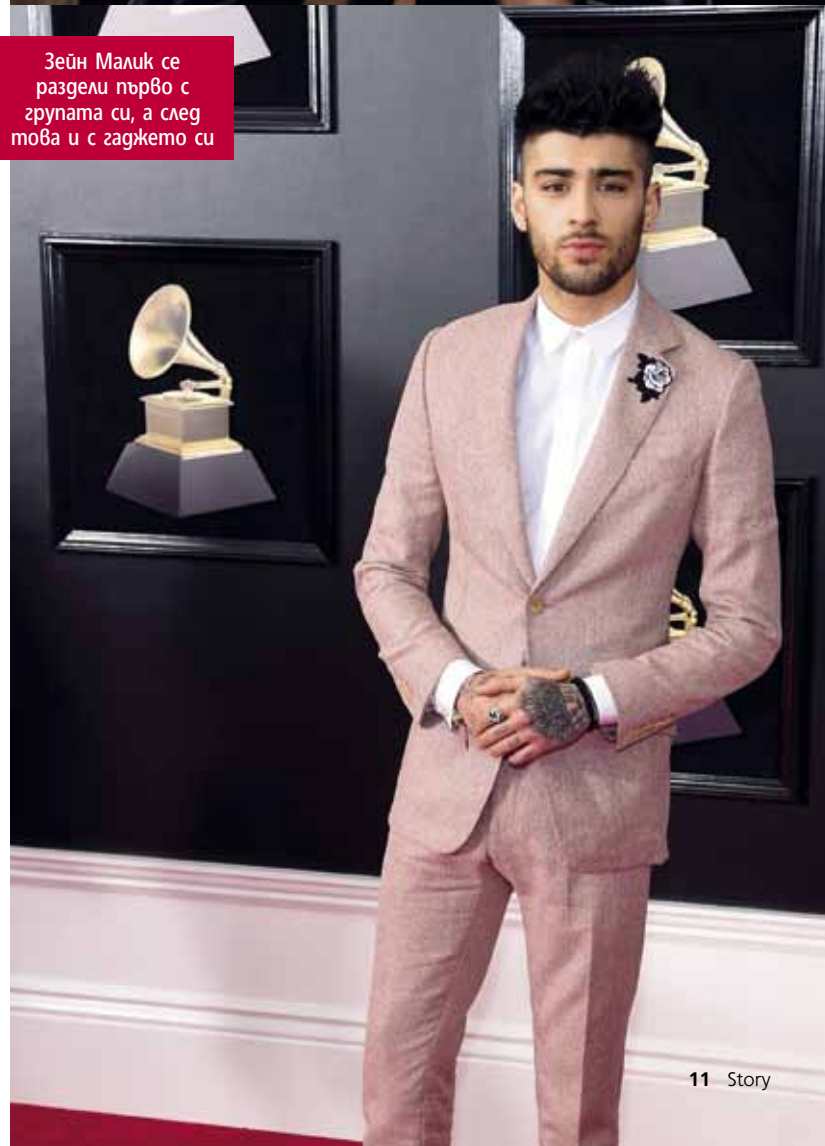
Зейн Малик се раздели първо с групата си, а след това и с гаджето си