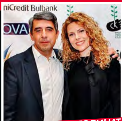
СЕНЗАЦИЯТА НА ГОДИНАТА РОСЕН ПЛЕВНЕЛИЕВ И ДЕСИ БАНОВА