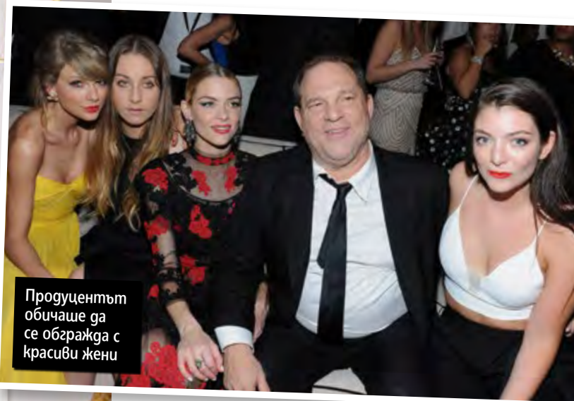
Продуцентът обичаше да се обгражда с красиви жени