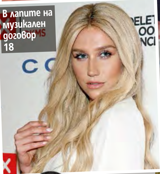
В ланите на музикален разговор 18