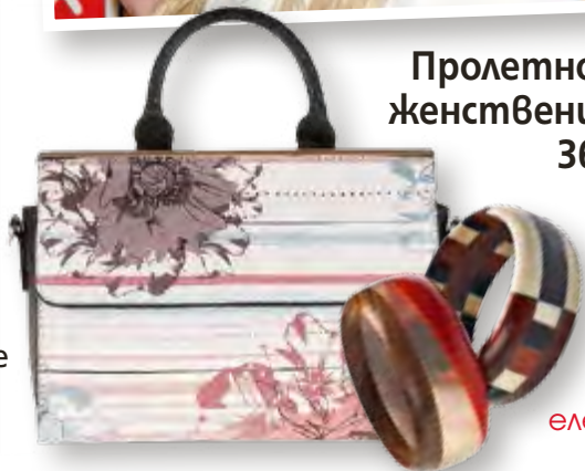
Пролетно женствени 36

Посетете страницата ни във facebook списание „Story“